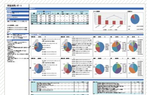
リニューアル後の求人レポートシステム