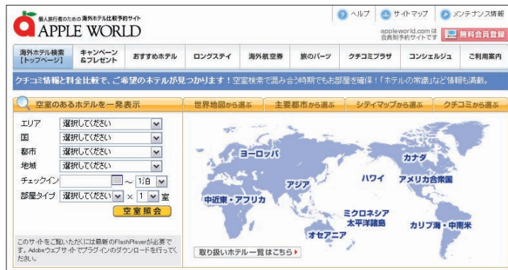
図1 アップルワールドのトップページ