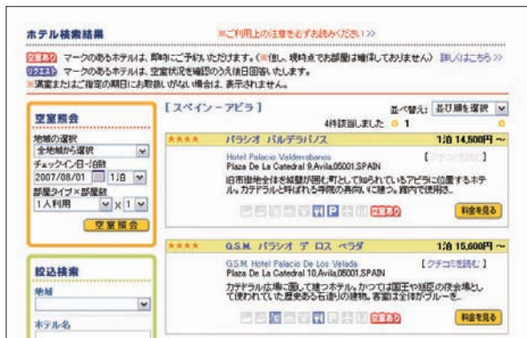
図2 スペイン・アビラ検索結果 スペイン、アビラ、8/1 から一泊、一人部屋で検索したところ、4軒にヒット。 検索時間4秒。