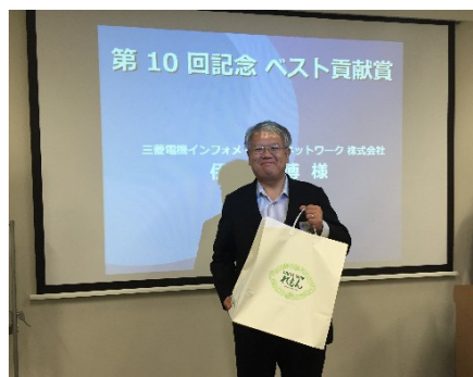
ベスト貢献賞の進呈