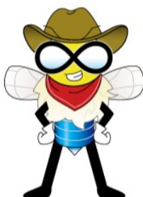
オリジナル・キャラクター 「インディ (Indy)」

また、新バージョンInfiniDB 3の発表に合わせ、オリジナル・キャラクター「インディ(Indy)」を作成しました。