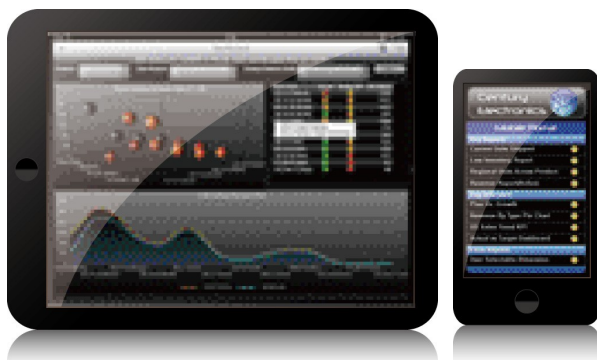
ワンソース・マルチデバイス開発によるモバイル対応強化