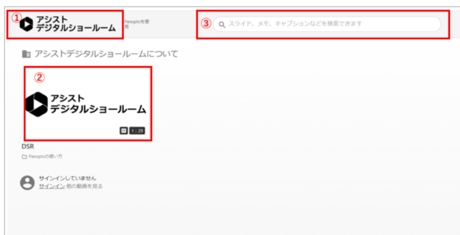
図1: デジタルショールーム トップ画面

https://ashisuto-knowledge-platform.ap.panopto.com/Panopto/Pages/Home.aspx