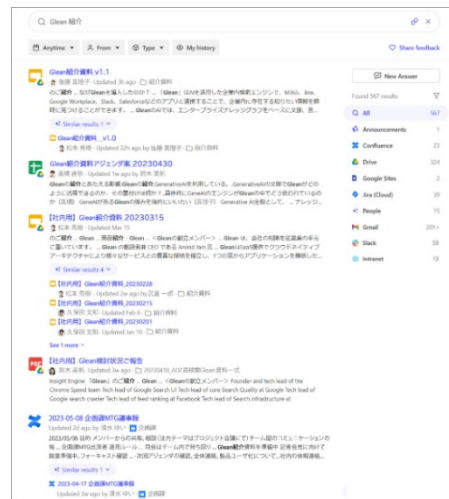
検索結果。データソース(アプリ)で絞り込み可能