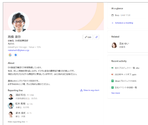
ナレッジを持つ人を見つけられる